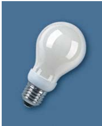
Abbildung 3 — Kompakt-Leuchtstofflampe mit eingebautem Vorschaltgerät in klassischer Glühlampenform mit Schraubsockel E27

Über die Anforderungen der Sicherheitsnormen hinaus bestehen Arbeitsweise-Anforderungen und -Prüfungen etwa für den Lichtstrom, die Lebensdauer und die Farbe, sofern sie festgelegt wurden, in den Normen für die Arbeitsweise DIN EN 60064, DIN EN 60357 und DIN EN 60969. Während die Sicherheit im Gebrauch der Produkte vom Anwender als selbstverständlich angesehen wird – und auch werden darf –, bieten die Arbeitsweisenormen die Möglichkeit der Qualitätseinstufung, das heißt: für den Verbraucher die Wahl zwischen High-End- und Low-End-Produkten.