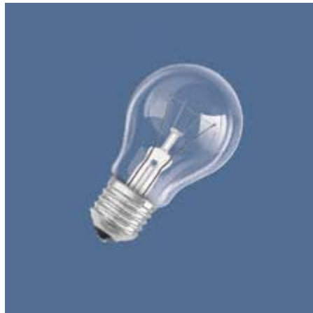
Abbildung 1 — Allgebrauchs-Glühlampe mit Sockel E27

Niedervolt-Halogenlampen, Netzspannungs-Halogenlampen mit Stecksockeln und Kompakt-Leuchtstofflampen mit Stecksockeln gehören nicht zu den hier untersuchten Lampen. Die Abbildungen 1, 2 und 3 zeigen Beispiele für Haushaltslampen. Für diese Untersuchung soll es