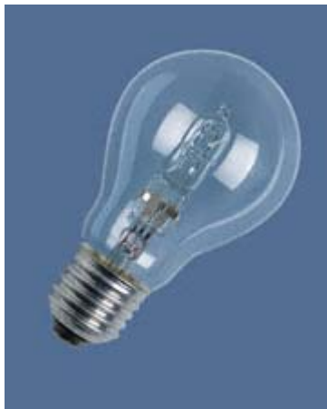
Abbildung 2 — Halogen-Glühlampe mit Sockel E27

Durch die Anwendung von DIN EN 60432-1, DIN EN 60432-2 und DIN EN 60968 entstehen zahlreiche Vorteile. Hier einige Beispiele für den Nutzen dieser Normen: